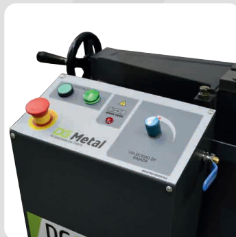
Comando de tablero con botón de marcha y botón de parada.