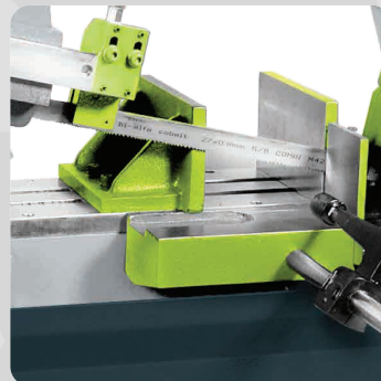
Morsa fija y morsa móvil para el apriete del material y posterior corte.