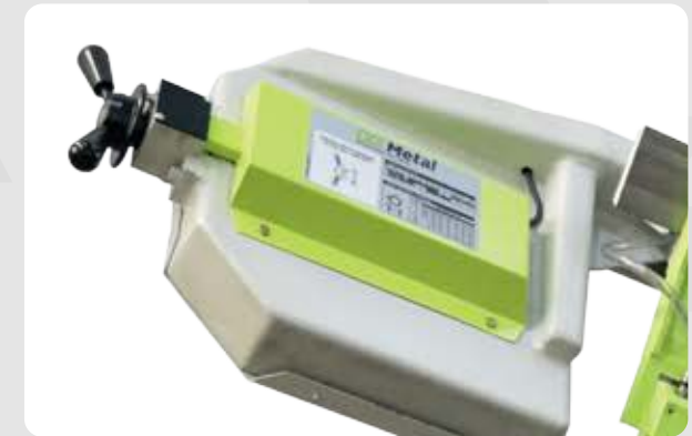
Tensor de hoja con luz testigo y medida de seguridad ante corte o tensión incorrecta de la cinta.