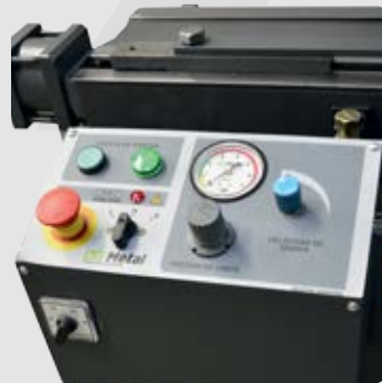
Comando de tablero y sistema de coliza para mayor precisión de cortes.