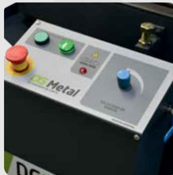
Comando de tablero con botón de marcha y botón de parada.