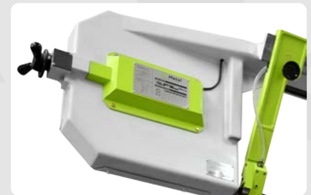
Tensor de hoja con luz testigo y medida de seguridad ante corte o tensión incorrecta de la cinta.