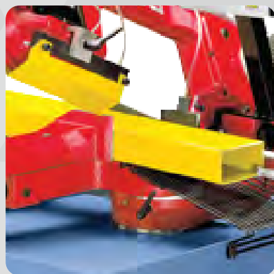
Morsa fija y morsa móvil para el apriete del material y posterior corte.