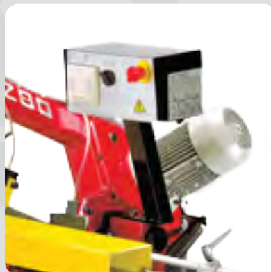
Comando de tablero con botón de marcha y botón de parada.