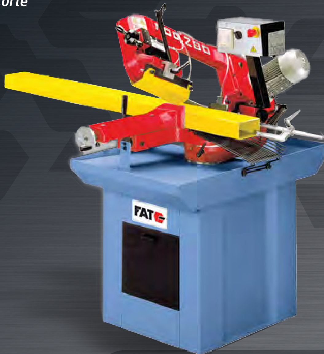
FAT 280 M 60° Máquina Cortadora MANUAL SENSITIVA